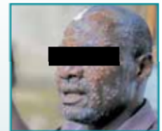
Gráfico: Erick Retana / Fuente: cdc.gov