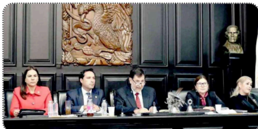
Integrantes de la Mesa Directiva, y el presidente, Gerardo Fernández Noroña