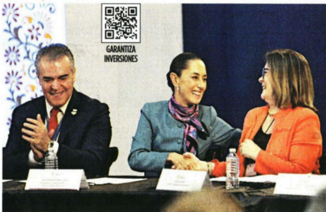
■ La Presidenta Claudia Sheinbaum encabezó el encuentro empresarial CEO Dialogue, que reunió a 240 líderes de empresas en la Ciudad de México.

“Hay una ligera baja en el sector primario, principalmente en agricultura, que está asociado a los años de sequía que vivimos. No es algo que represente un problema estructural”, aseveró.