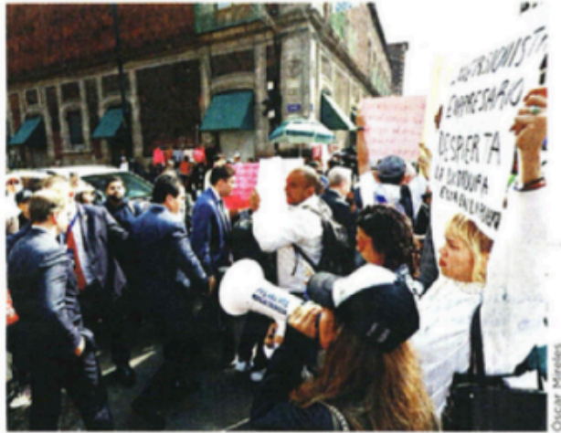
Algunos invitados tuvieron que esquivar la manifestación.