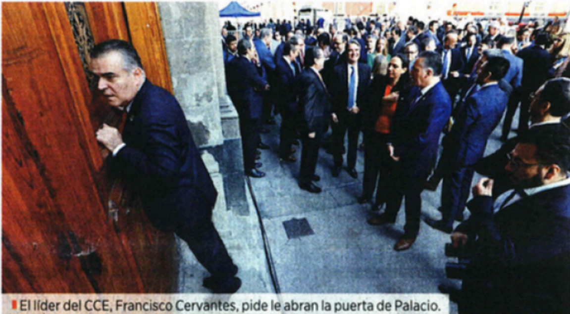
■ El líder del CCE, Francisco Cervantes, pide le abran la puerta de Palacio.