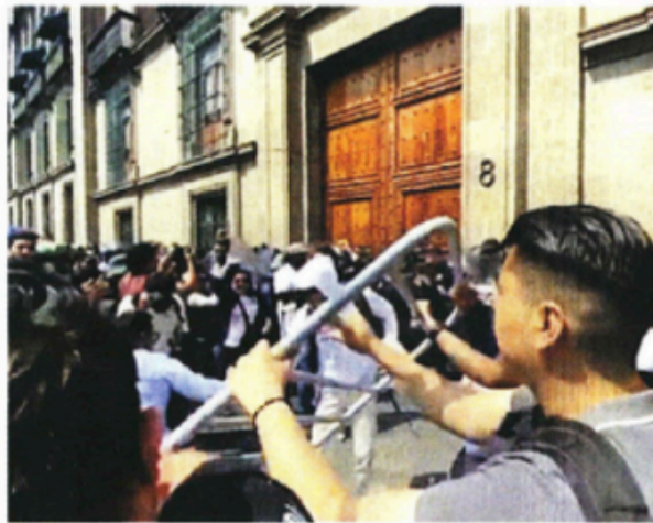
Tras derribar las vallas metálicas, trabajadores del Poder Judicial protestaron afuera de la puerta 8 de Palacio Nacional.