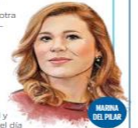
MARINA DEL PILAR

Davos, otra vez México no envió delegación que lo representara. Ni la Secretaría de Economía, que lleva Raquel Buenrostro, ni la Secretaría de Relaciones Exteriores, a cargo de Alicia Bárcena, hicieron acto de presencia con algún funcionario, tal y como lo mandató desde el día que asumió la presidencia Andrés Manuel López Obrador. No obstante, en esta edición, que arrancó desde el domingo si acudieron dos gobernadores de Morena. Apunte a Marina del Pilar, de Baja California, y a Alfonso Durazo, de Sonora. Asimismo, el gobernador panista de Yucatán, Mauricio Vila. Empresarios mexicanos, cada vez menos también.