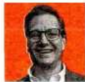
Salomón Chertorivski Woldenberg

Cargo anterior: alcalde de Benito Juárez