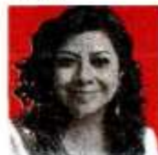
Clara Brugada Molina

Seguiremos Haciendo Historia en Ciudad de México