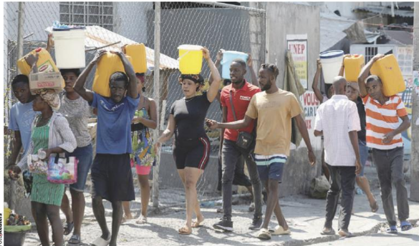
HABITANTES de Puerto Príncipe cargan agua en cubetas y contenedores, el pasado 12 de marzo.

La activista consideró que el Gobierno de México debe contar con una política migratoria adecuada para regularizar a los haitianos, pues sus ciudadanos realmente necesitan ser protegidos.