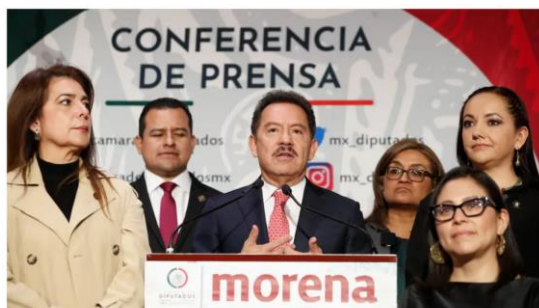
El líder de Morena en San Lázaro adelantó la acción que pretenden contra el presidente de la Segunda Sala de la SCJN (Cámara de Diputados)

Y es que como parte del dictamen que se aprobó con 19 votos a favor y 10 en contra, se prevé que una vez que el trabajador cumpla 70 años, se le notificará sobre la existencia de los ahorros y en caso de que estos no sean reclamados, pasarán a manos del Fondo de Pensiones para el Bienestar.