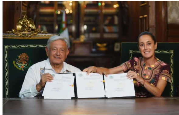
Andrés Manuel López Obrador y Claudia Sheinbaum en el Palacio Nacional, el 16 de septiembre 2024.

El presidente mexicano firma la controvertida ley en el Día de la Independencia, acompañado de la presidente electa, Claudia Sheinbaum