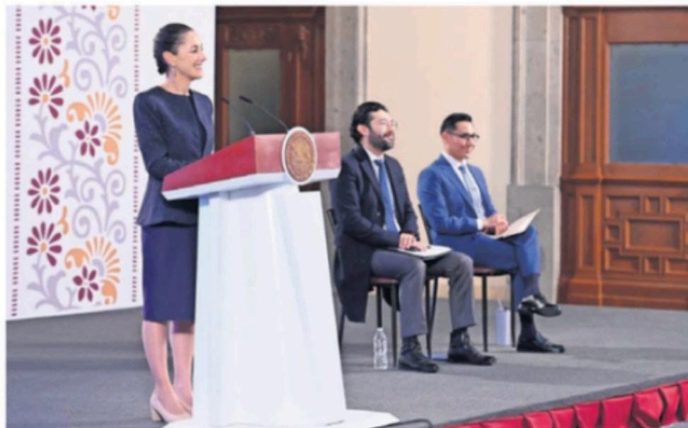
La presidenta Claudia Sheinbaum llamó a los legisladores de la autollamada Cuarta Transformación a dejar la comodidad de las curules y salir a ras de tierra.

“Para atender esta propuesta que nos hizo el expresidente hace unos días y que ahora retoma la presidenta Claudia, la semana que entra nos estaremos reuniendo senadores y diputados para que volvamos a territorio y que al volver a presidir reuniones distritales, municipales, ejidales, comunitarias, expliquemos qué es lo que estamos haciendo, cuáles son las reformas que se han aprobado y, sobre todo, la reforma judicial, su alcance, su contenido y sus consecuencias en beneficio de la población”, declaró el legislador morenista. ●