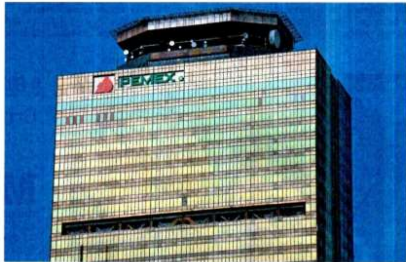
Petróleos Mexicanos (Pemex) ya ha recibido inyecciones por cerca de 2.2 billones de pesos en apoyos fiscales y patrimoniales.

Nota: Los principales recursos que la Federación le transfiere a estados y municipios se desprenden de la Recaudación Federal Participable. *Por el nuevo apoyo a Pemex. Fuente: Elaboración propia con proyecciones de analistas y cifras de la SHCP.