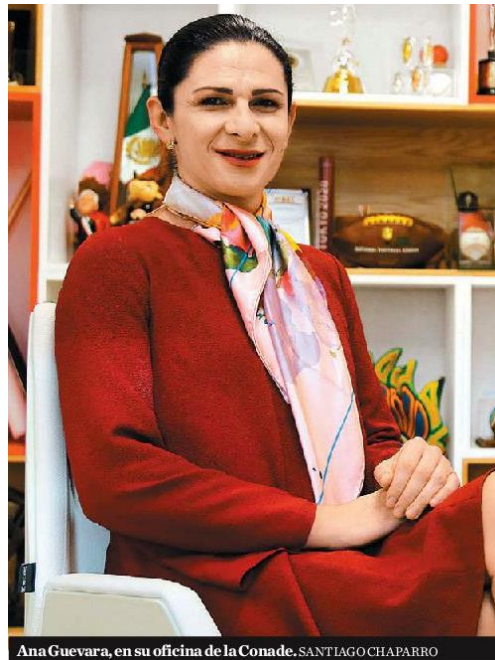
Ana Guevara, en su oficina de la Conade.

Dentro de los señalamientos hemos colaborado con todas las autoridades involucradas, no hay nada debajo de la alfombra, no escondemos absolutamente nada, se ha colaborado con todas las autoridades; en un inicio fue la Función Pública, después la Auditoría Superior de la Federación, el propio Instituto Nacional de Acceso a la Información, la Fiscalía Federal y local, así que afortunadamente hemos podido transitar bajo la responsabilidad que nos atañe. Hay que aclararlo: hay imputaciones que han sido falsas y que carecen de sustento, además, hay expedientes y averiguaciones que se han hecho públicos que ya han causado conclusión. La responsabilidad me exime hasta que concluya la administración y seguimos en lo mismo, entonces no es un tema que nos preocupe, pero que sí nos ocupa porque hay que responder.