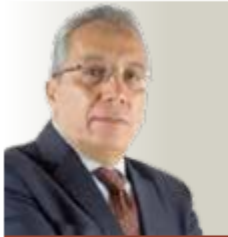
POR LUIS SOTO @LUISSOTOAGENDA