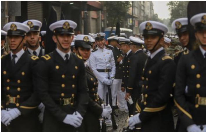
Luis Crescencio Sandoval, secretario de la Defensa; Andrés Manuel López Obrador, Presidente de México, y José Rafael Ojeda Durán, secretario de Marina, encabezaron el Desfile Cívico Militar para conmemorar el 214 Aniversario de la Independencia de México.