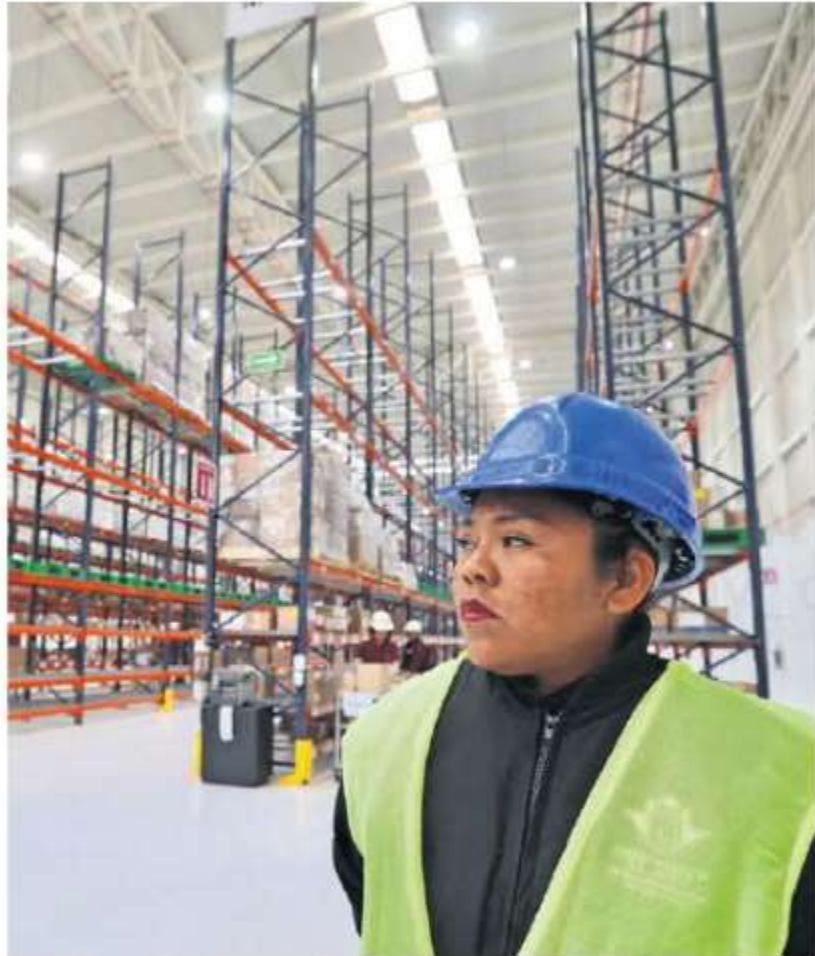
A 19 días de la inauguración de la Megafarmacia, la bodega presenta desabasto que ha sido denunciado por los pacientes.