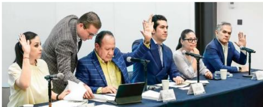
DIÁLOGO. Luego de que la Permanente retrasara la comisión, este martes iniciará el análisis para abrir la discusión al Plan C.

Tras los dichos y una votación a mano alzada, se incluyó en los asuntos generales, no obstante, el presidente del órgano, el morenista