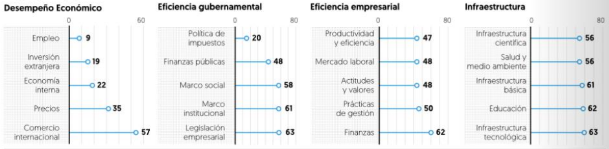
Fuente: IMD World Competitiveness Yearbook 2024

● Lugar que ocupa por indicador entre 67 economías