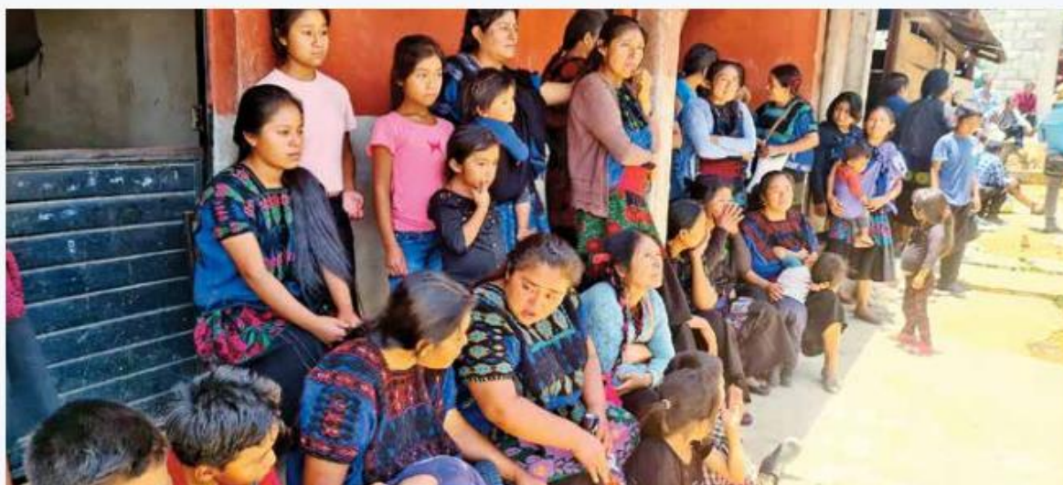
Las familias exigen a las autoridades que les devuelvan la paz, porque se están enfermando.