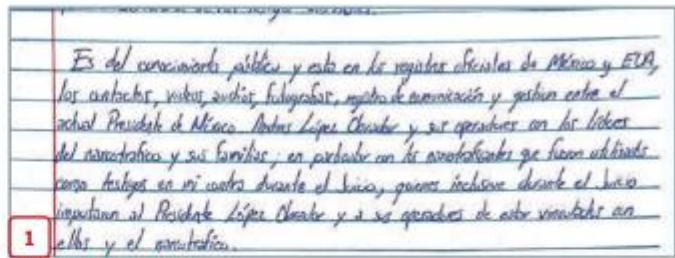
EL EXSECRETARIO hace señalamientos contra el Presidente.