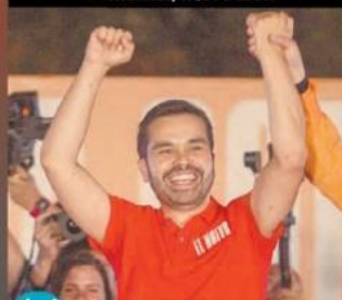
JORGE ÁLVAREZ MAYNEZ, MONTERREY, NUEVO LEÓN

“ En el México nuevo no habrá derecho de piso; tampoco se aceptará ni se normalizará que haya mujeres desaparecidas. Basta de que la gente tenga miedo y de que viva sin saber qué va a pasar con su vida”.