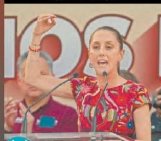
CLAUDIA SHEINBAUM PARDO, CIUDAD DE MÉXICO

“ Llegamos a este momento unidos, fuertes y victoriosos. El valor de la unidad de nuestro movimiento es innegable; vean a la derecha en una división interna por incumplir pactos sin escrúpulos”.