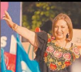
XÓCHITL GÁLVEZ RUIZ, ACÁMBARO, GUANAJUATO

“ El actual presidente decidió darle abrazos a los delincuentes y balazos a los ciudadanos. No quiero enfrentar a la delincuencia. Yo sí lo voy a hacer y no le voy a echar la culpa a Calderón ni a este gobierno”.