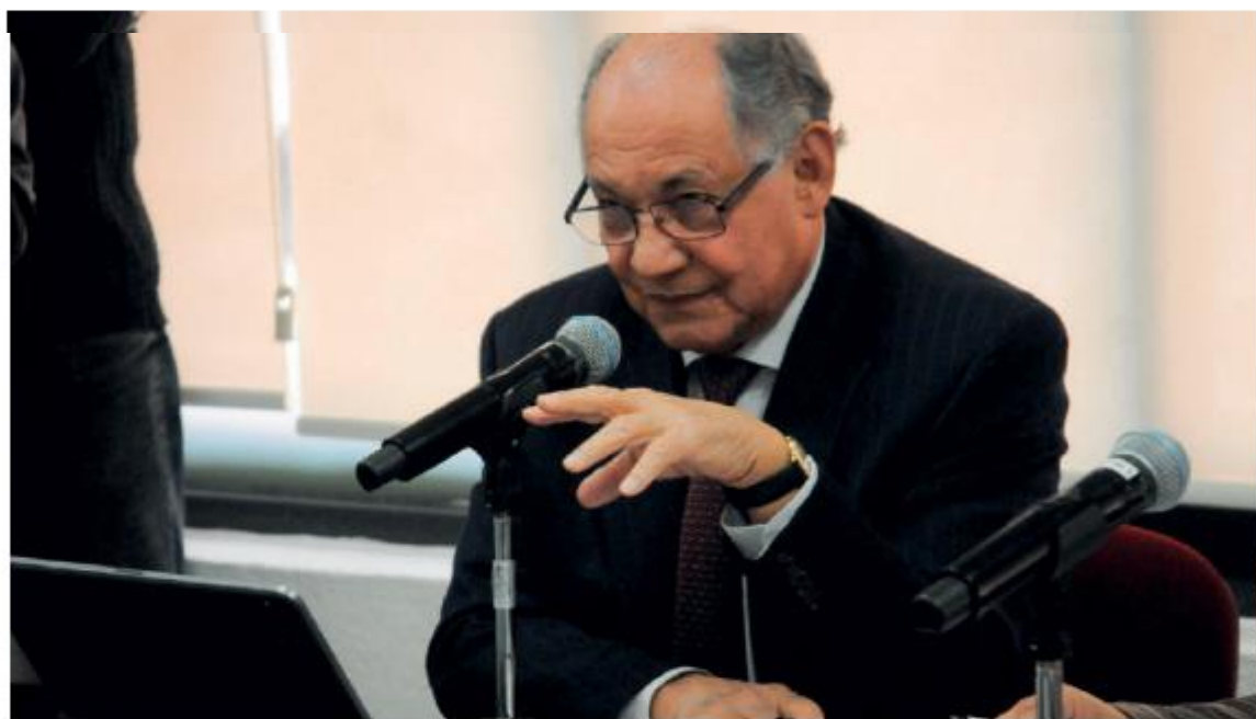
Morena afirma que el único órgano autónomo que pretenden desaparecer es el INAI

uno respecto del cuál él ha sido muy insistente por su inoperancia y por su, pues eso, vacuidad, que es el INAI. Hay otros muy importantes que son un sostén constitucional del país, como el Instituto Nacional Electoral, como el Banco de México, esos pues ni pensar, el Instituto Nacional de Es-