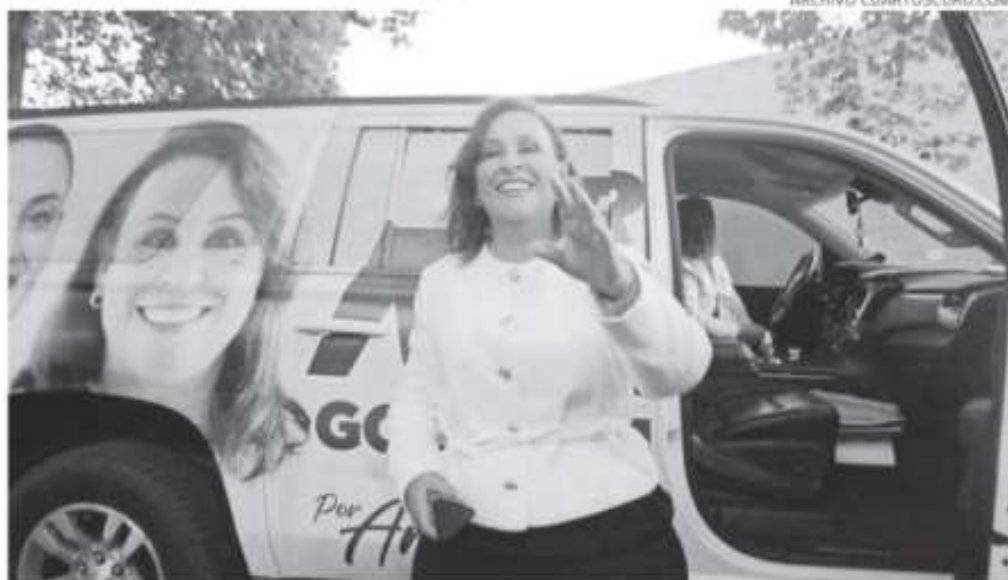
Rocío Nahle García, gobernadora electa del estado de Veracruz