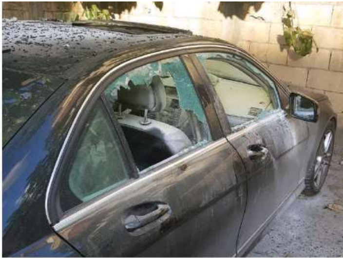
UN VEHÍCULO en calles de Beirut, en Líbano, evidencia el impacto de las explosiones al quedar con las ventanas rotas, ayer.