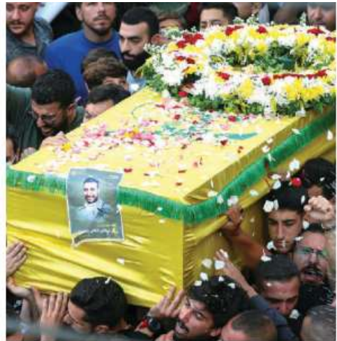
MILES DE RESIDENTES se suman a los funerales de presuntos terroristas tras el primer día de ataques.