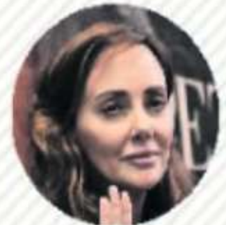
LILLY TÉLLEZ PAN