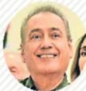
MANLIO FABIO BELTRONES PRI