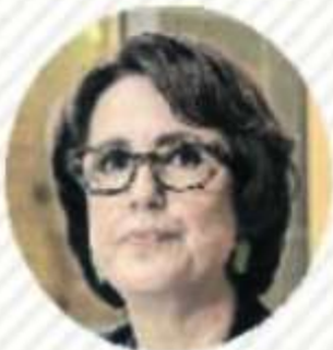
PATRICIA MERCADO Movimiento Ciudadano