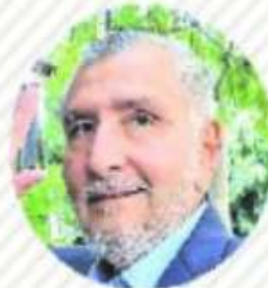
ADÁN AUGUSTO LÓPEZ Morena