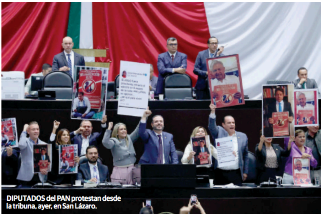
DIPUTADOS del PAN protestan desde la tribuna, ayer, en San Lázaro.