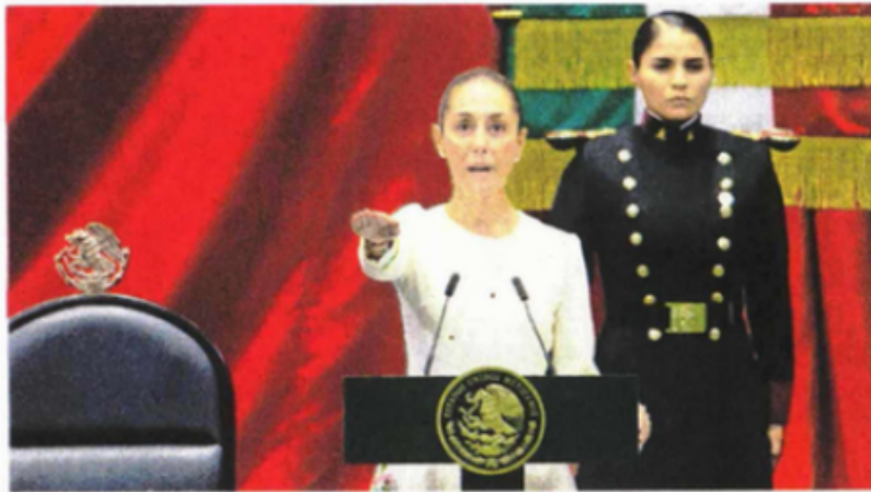
Claudia Sheinbaum rindió ayer protesta como presidenta durante sesión solemne en el Congreso de la Unión.