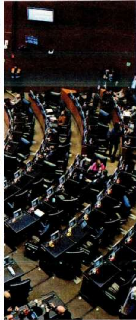
Pese a que se opusieron a la reelección, este año se aplicará por primera vez.