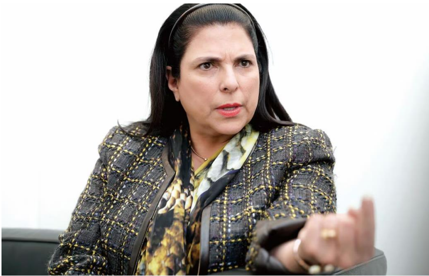
Marcela Guerra Castillo recordó que, de acuerdo a Latinometrics, el intercambio de bienes y servicios México-Texas, en 2022, ascendió a 286 mil millones de dólares.

La presidenta de la Mesa Directiva de la Cámara de Diputados, Marcela Guerra Castillo, calificó como "muy desafortunada" la entrada en vigor de la Ley SB4 en Texas, y consideró que la medida criminaliza la migración y es violatoria de derechos humanos.