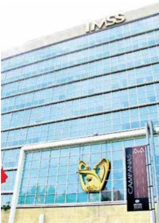
Pensiones dignas y justas.

Con los días del periodo ordinario de sesiones contados, esta es una de las prioridades legislativas junto con las reformas a la Ley de Amparo, a la Ley de Amnistía y las iniciativas presentadas por López Obrador el 5 de febrero. V