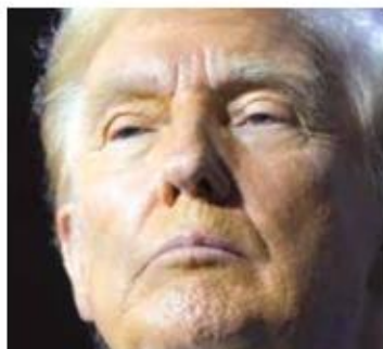
JOE BIDEN Presidente de EU

“Las encuestas de Fox News siempre son lo peor para mí. Lo han sido desde el principio y siempre lo serán”