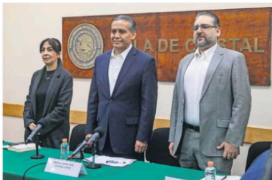
Ayer se efectuó la primera conferencia de prensa matutina de los juzgadores, que se realizará todos los días como réplica al Poder Ejecutivo.

vencia, pero en este momento los asuntos se encuentran en la zona de los tribunales, como corresponde a un proceso de reforma tan importante como éste. Entonces, la postura que tienen la Presidencia y los legisladores es legítima, en parte, ellos no son los jueces, no les corresponde a ellos la última palabra, les corresponde a los jueces, y hay que dar tiempo a los procesos judiciales para que se vayan pronunciado de acuerdo con las impugnaciones que haga la ciu-