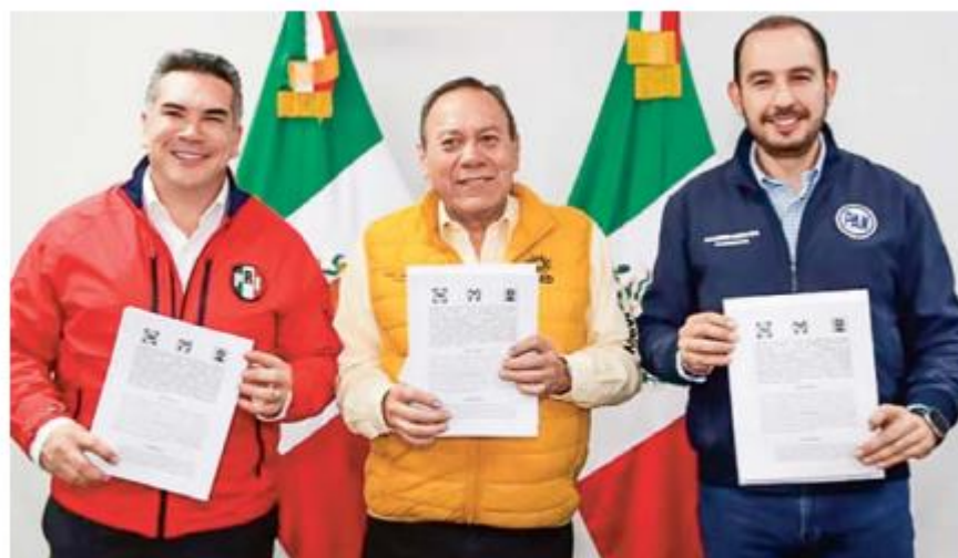
ALIANZA. Apenas el lunes, los líderes del PRI, PAN y PRD registraron ante el INE a la coalición Fuerza y Corazón por México.

Sin embargo, para la vicecoordinadora de los senadores del PAN, Kenia López, “ninguna división será suficiente para detener la ola y gran avance del Frente” y consideró que los problemas internos de un partido no afectan las candidaturas.