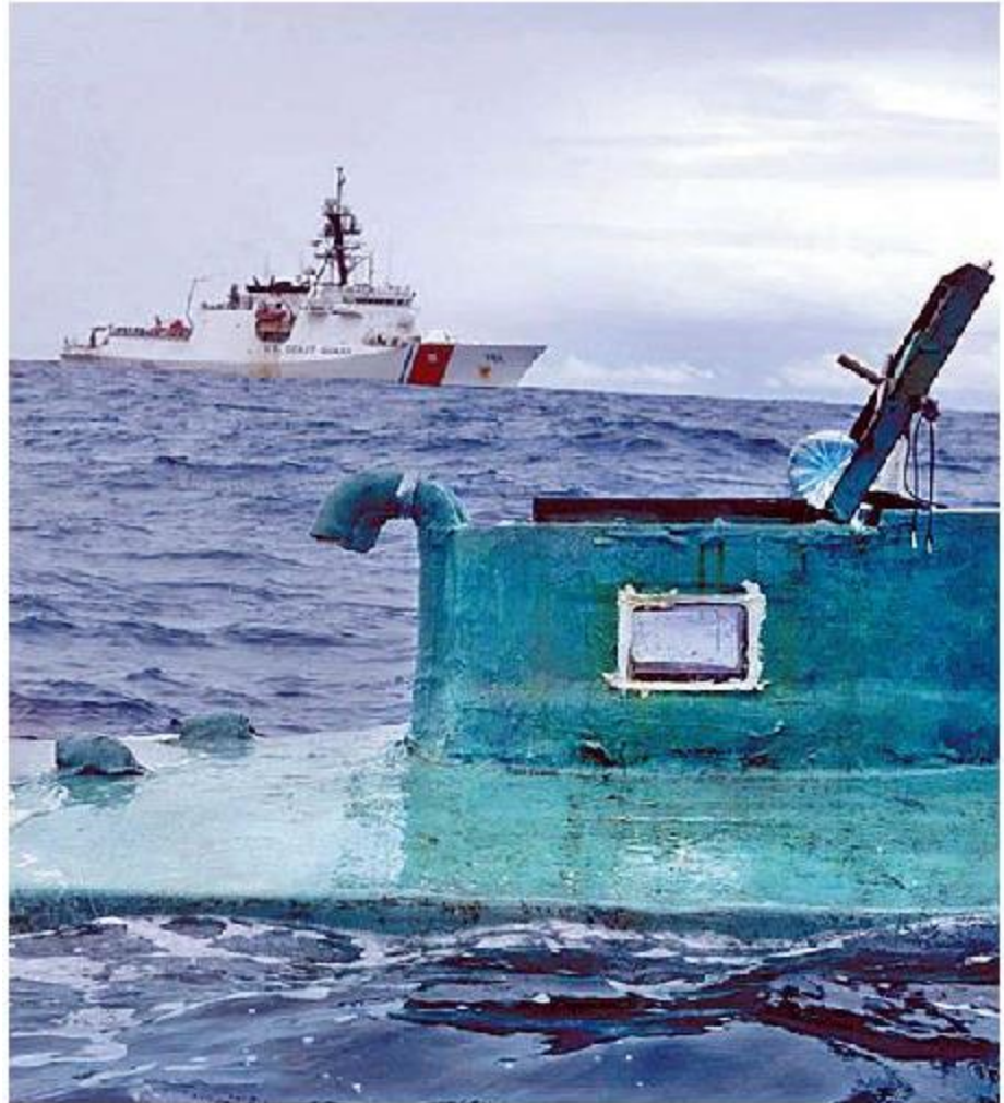
Semisumergible usado para el contrabando. ESPECIAL

Es difícil saber qué tipo de embarcación con droga descubre la Guardia Costera en cada incautación, ya que en pocos informes revelan el modelo exacto interceptado; no obstante, en aquellas donde sí hicieron públicas las características destacan semisumergibles y lanchas rápidas. ■