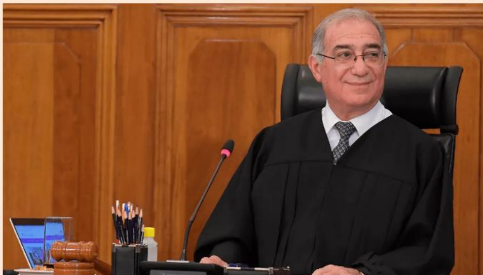
Alberto Pérez Dayán, presidente de la Segunda Sala de la SCJN.