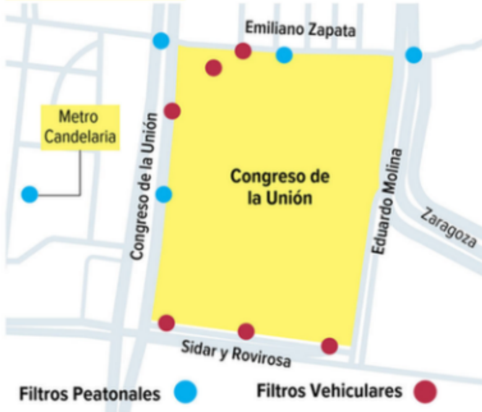
Mapa: Horacio Sierra

Los accesos a la Cámara baja se encuentran vigilados por policías capitalinos.