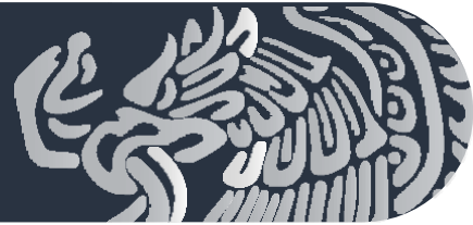
Norma Lucía Piña Hernández

PODER LEGISLATIVO FEDERAL CÁMARA DE DIPUTADOS