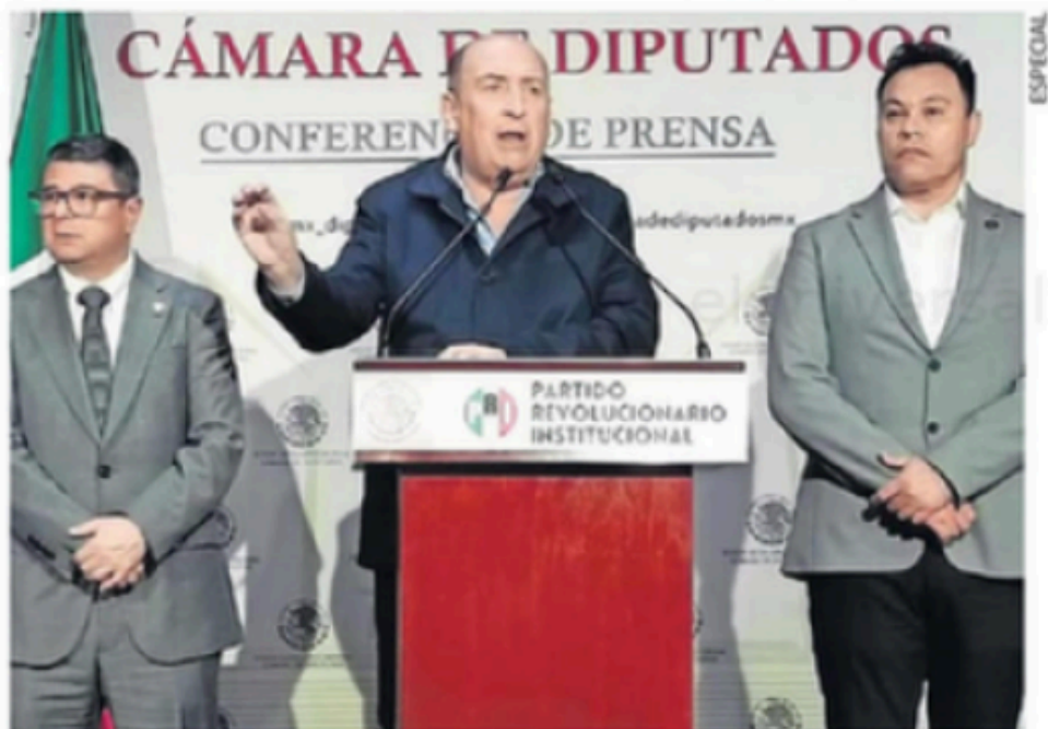
Rubén Moreira, coordinador del PRI, dijo que la propuesta de Morena contraviene la reforma constitucional de 2010-2011.