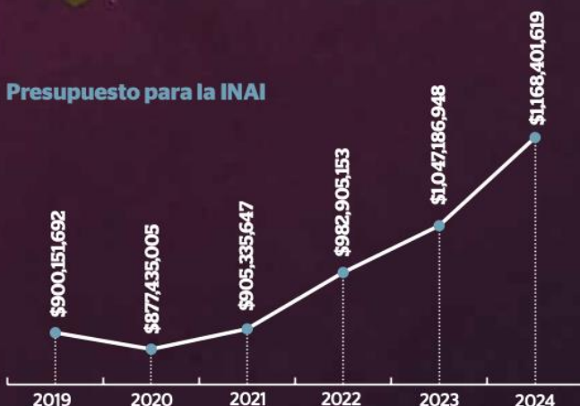
Presupuesto para la INAI

Cabe destacar que la percepción bruta al mes que obtiene la presidenta de la CNDH, de acuerdo con el “Tabulador Mensual de Sueldos en Importes Brutos 2023 del organismo, es de 151 mil 266.43 pesos. De esta cifra, el sueldo base es de 30 mil 25.63 pesos y la compensación garantizada es de 124 mil 240.80 pesos.