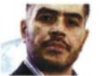
■ Omar García Harfuch, ex secretario de Seguridad de la CDMX