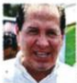
■ Eruviel Ávila