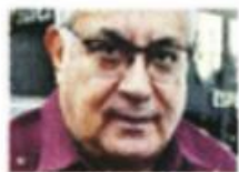
■ Alfonso Cepeda, líder nacional del magisterio