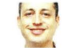
■ Luis Donaldo Colosio, Alcalde de Monterrey