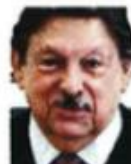
■ Napoleón Gómez