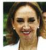
■ Claudia Ruiz Massieu