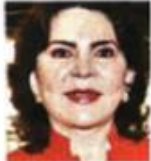
■ Ivonne Ortega