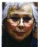
■ Olga Sánchez Cordero