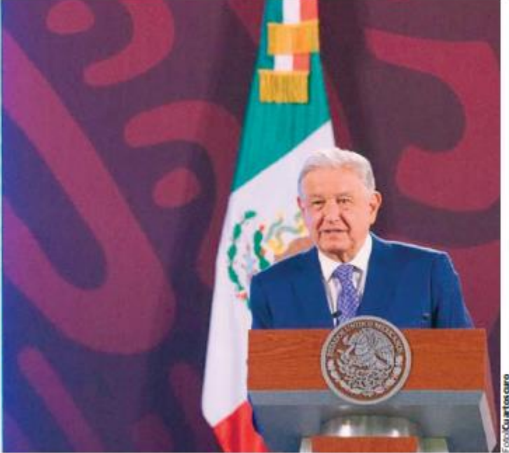
EL PRESIDENTE Andrés Manuel López Obrador, argumentando sobre la sobrerrepresentación.