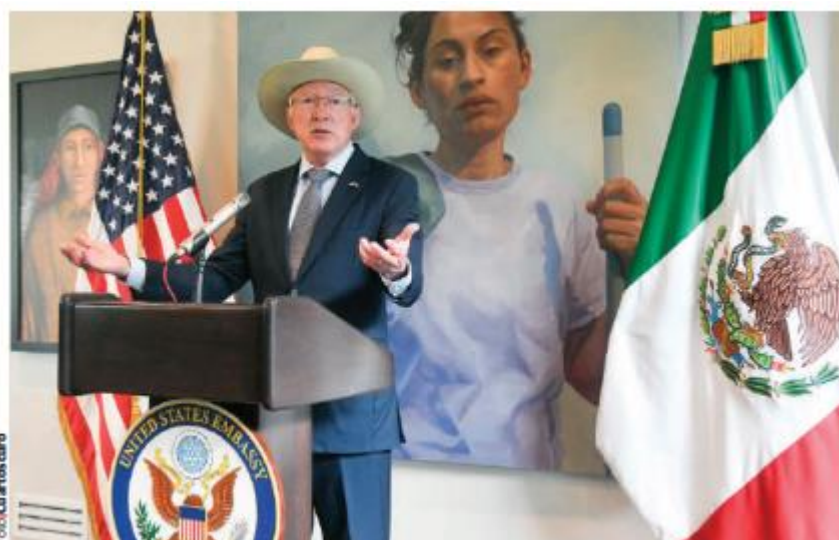
EL EMBAJADOR de EU en México, Ken Salazar, ayer, en conferencia de prensa.

QUIENES ASPIREN a las vacantes no podrán ser financiados ni se deberán respaldar de apoyos partidistas.