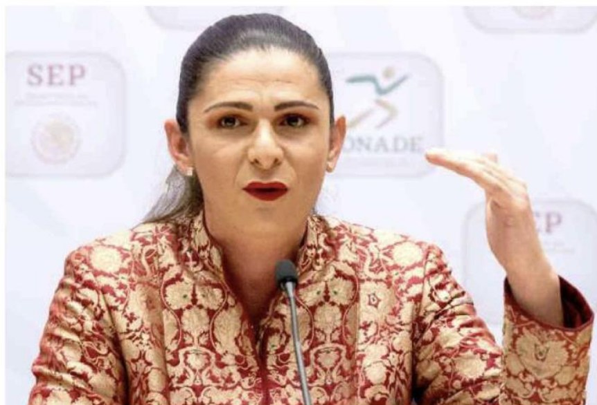
Ana Gabriela Guevara Espinoza

La auditoría encontró que tan sólo en 2020 hubo 18 actos distintos de posible corrupción y mal manejo de recursos en distintos contratos y servicios adquiridos por la Conade.