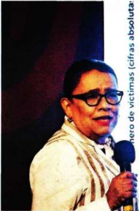
La gran Interrogante es Rosa Icela Rodríguez.