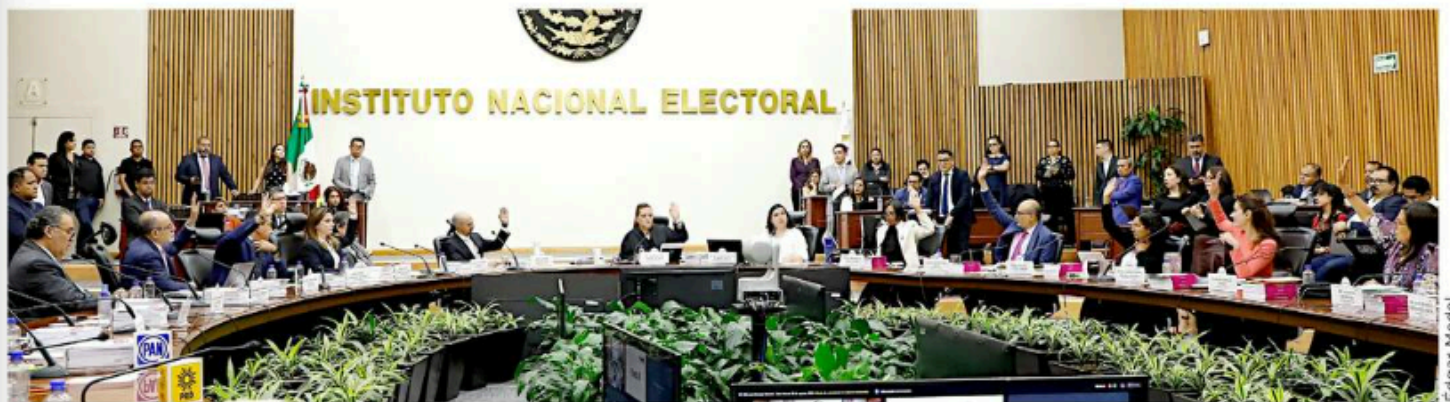
El Consejo General del INE concedió la mayoría calificada en San Lázaro al bloque oficialista.

Dan a bloque oficial 83 senadurías; con 86 tendrían mayoría calificada