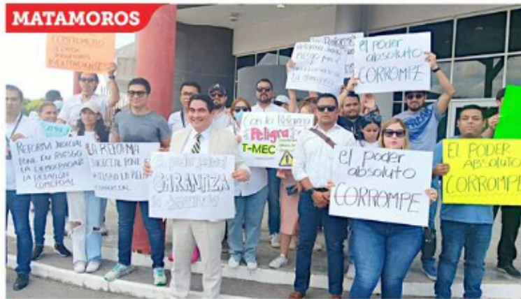
■ Al grito de “No te dejes engañar, nosotros no liberamos a delinquentes, protestaron en el Congreso local.

“El Pleno, por mayoría de votos, tomó conocimiento de la declaratoria de la Asociación Nacional de Magistrados de Circuito y Jueces de Distrito del Poder Judicial de la Federación (JUFED) con la que se suspendió actividades en los órganos jurisdiccionales del PJJ, con excepción de la Suprema Corte de Justicia de la Nación y del Tribunal Electoral del