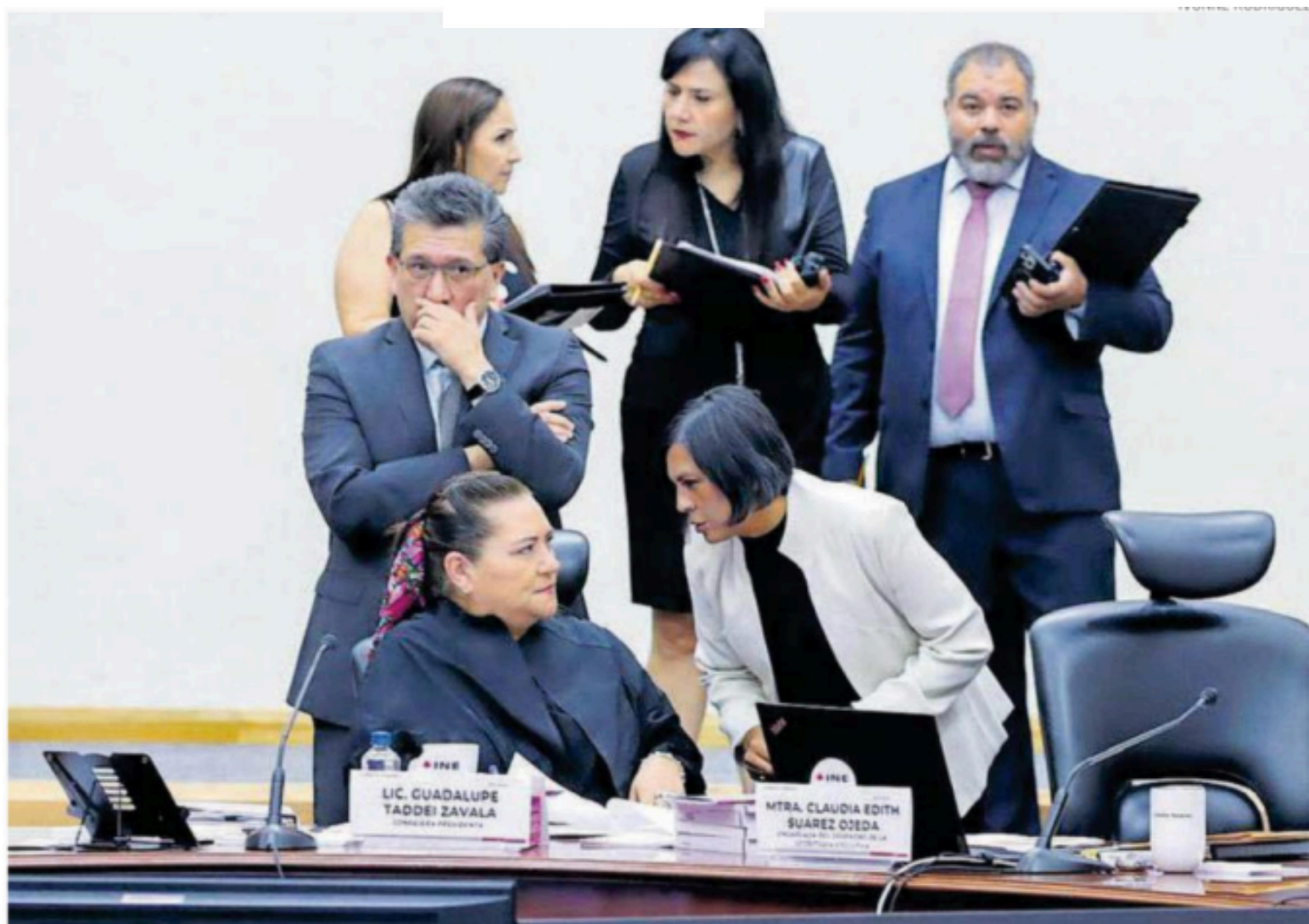
La consejera presidenta del INE, Guadalupe Taddei, habla con la consejera Norma de la Cruz

EL PAN , PRI, Movimiento Ciudadano, PRD y un independiente suman 135 curules, mismos que son insuficientes para presentar una acción de inconstitucionalidad ante la Suprema Corte en contra de alguna reforma