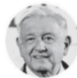
ANDRÉS MANUEL LÓPEZ OBRADOR Presidente de México

“Embajadores de Estados Unidos y Canadá ponen peros [a reforma judicial]. ¿Quiénes son ellos?, con todo respeto”