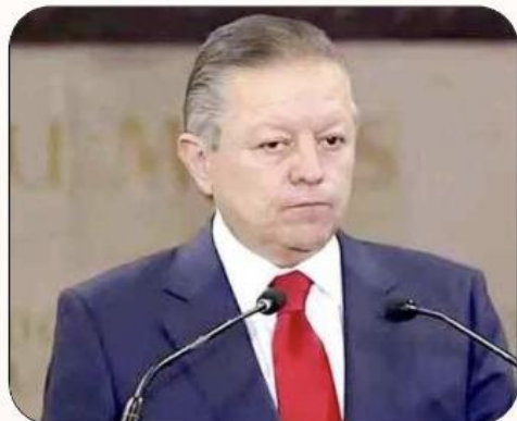
Arturo Zaldívar Lelo de Larrea