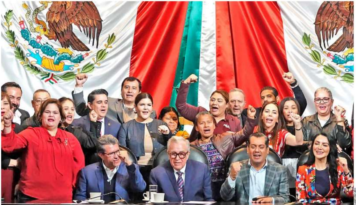
ESPALDARAZO. El mandatario sinaloense, Rubén Rocha Moya, acudió a la Cámara de Diputados y al Senado de la República, sedes legislativas en las que recibió el apoyo de los miembros del bloque oficialista, que incluso gritaron ¡no estás solo!, mientras lo rodeaban.

Finalmente, señaló que él mismo votó por el gobernador de Morena y como él hay miles de ciudadanos que están decepcionados de su Gobierno y estarían dispuestos a participar en la consulta.