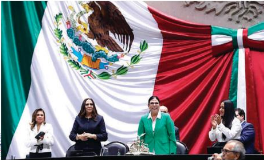
CLAUSURA del periodo ordinario de sesiones en San Lázaro, el pasado martes.