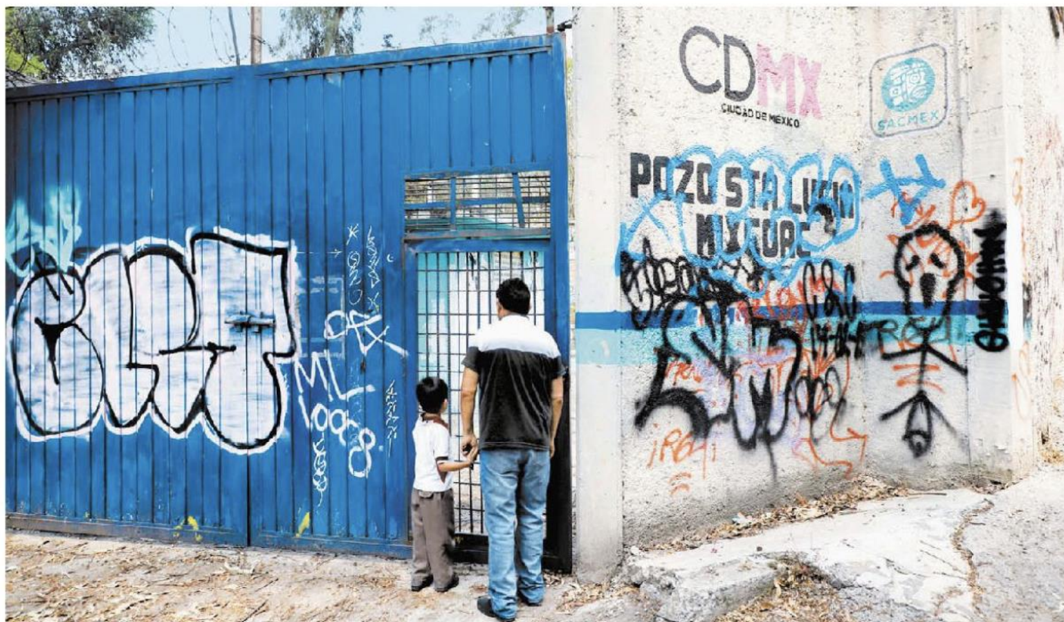
La dependencia firmó contratos por 152 millones de pesos con diversas empresas para alcanzar 18 venas de agua. JAVIER RÍOS